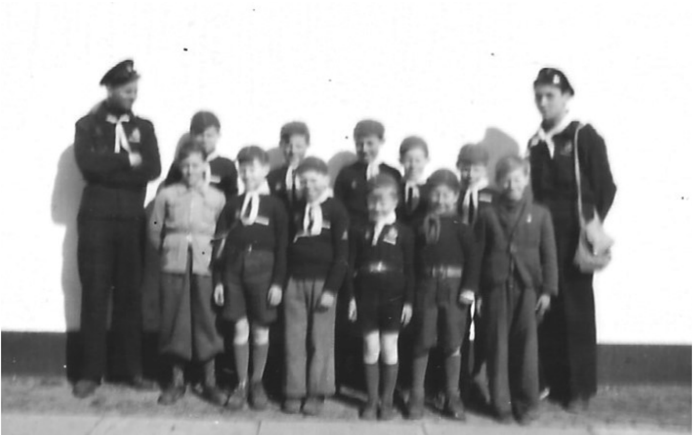
Vi glemte et 75-års jubilæum sidste år : De første søulve startede i 1947